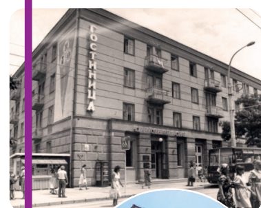
Гостиница «Черноморская», сейчас бизнес центр. Является памятником архитектуры. До войны на месте гостиницы «Черноморской» находилось интересное здание, о котором нет никакой информации. Год постройки 1959, фото 80-х годов.