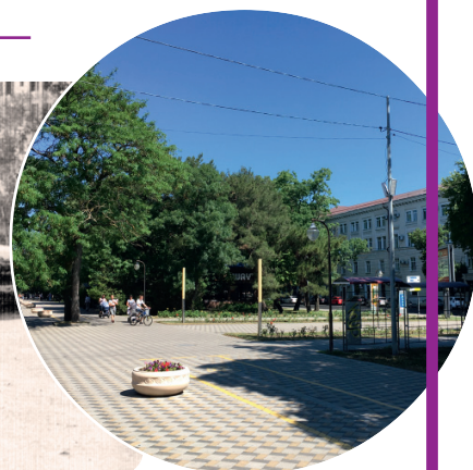
Парковая аллея 1950е годы, колледж строительства и экономики ещё в процессе возведения.