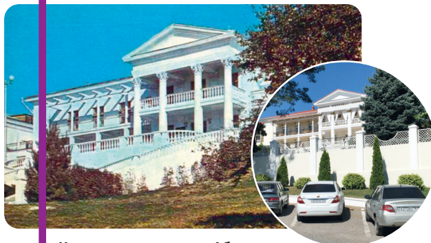
Некогда гостиница «Абрау», теперь отель «Империал». Фотографии 60-70-х годов.