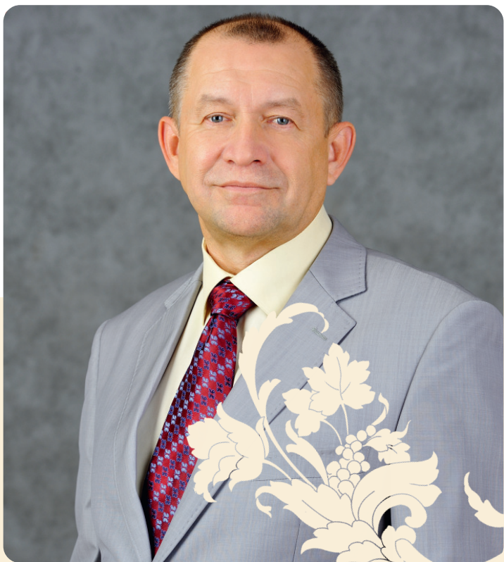
Коллектив Союза «Новороссийская торгово-промышленная палата» поздравляет президента Палаты

Телефон Бизнес-Центра Союза НТПП 60-12-52