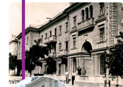
Улица Новоросийской республики, послевоенное восстановление города.