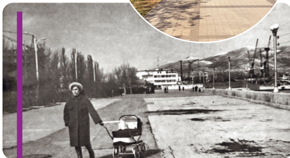
Набережная, центр города. 1974 год. Тот случай, когда город на современном фото выглядит разительно лучше).