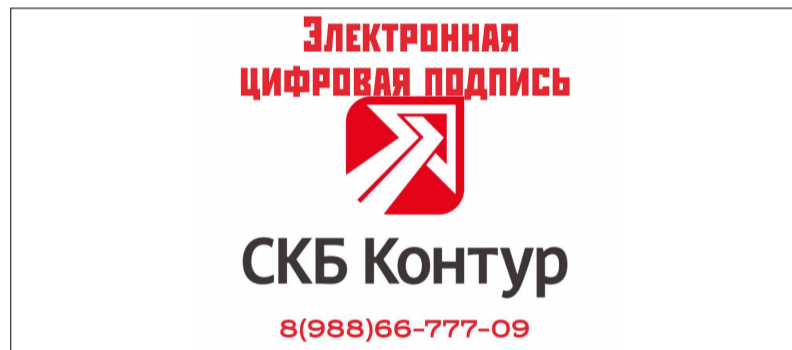
График работы: ежедневно 09:00 – 20:00

Парикмахерская находится по адресу: Московская, 3 (350 м. от гостиницы Бригантна, напротив ресторана Nostalgie)