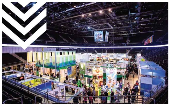
☘ Выставка «Rinkis prekę lietuvišką» («Выбирай товар литовский») 2016 ☘

Высоко оцениваемое качество литовских изделий напрямую отражается в ежегодно растущих объемах экспорта. Постоянная разработка новых продуктов так же способствует расширению на зарубежном и местном рынке. Одним из мест представления их на рынке является традиционная выставка «Rinkis prekę lietuvišką» («Выбирай товар литовский»).