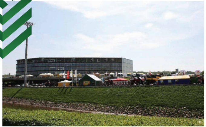
☘ Арена «Жальгирис» в Каунасе – самая большая в странах Балтии ☘